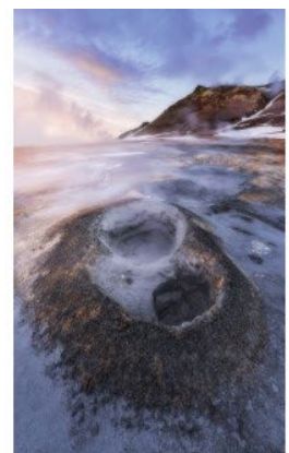
The Earth breathes Place 9 - Note 50

DOUBLET Guilhem UR 03 - Club 1231 - C.S.A. Ruelle Photo