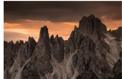
Orange Dolomites Place 3 - Note 52

CHRISTINE Youssef-Khalil UR 03 - Club 1624 - Grand'Angles - Angles-sur-l'Anglin