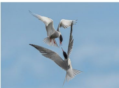
Ballet aérien Place 6 - Note 51

CHRISTINE Youssef-Khalil UR 03 - Club 1624 - Grand'Angles - Angles-sur-l'Anglin