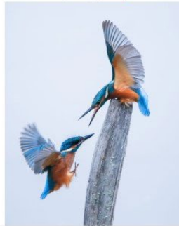
L'indésirable Place 2 - Note 55

BOULANGER René UR 03 - Club 1484 - PHOTO-VIDEO CLUB SNCF SAINTES