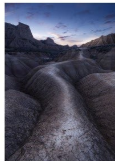
El camino Place 3 - Note 52

CHRISTINE Youssef-Khalil UR 03 - Club 1624 - Grand'Angles - Angles-sur-l'Anglin