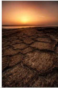
Dead Sea Place 10 - Note 49

LANORE Didier UR 03 - Club 1231 - C.S.A. Ruelle Photo