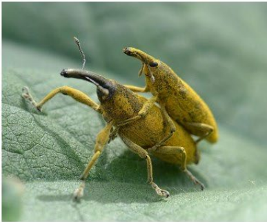
Lixus Place 1 - Note 56

BOULANGER René UR 03 - Club 1484 - PHOTO-VIDEO CLUB SNCF SAINTES