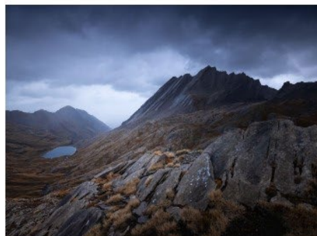
La Taillante Place 6 - Note 51

WEINLAND Katherine UR 03 - Club 0117 - Chatellerault Plein Cadre