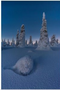
Laponie bleue Place 10 - Note 49

LANORE Didier UR 03 - Club 1231 - C.S.A. Ruelle Photo