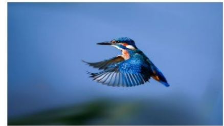
Mr Martin Place 6 - Note 51

MARIE Stanley UR 03 - Club 1231 - C.S.A. Ruelle Photo