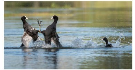
Désaccord Place 10 - Note 49

LANORE Didier UR 03 - Club 1231 - C.S.A. Ruelle Photo